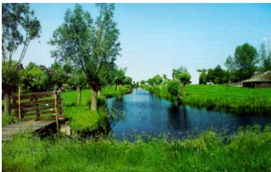
sfeerbeelden watermilieu - natuurlijke thema's