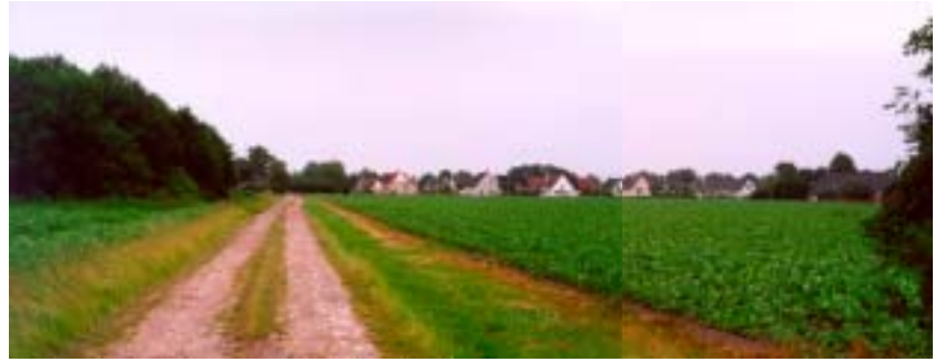
laan naar Schattersum