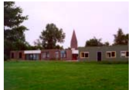
sfeerbeelden duurzaam inrichten en bouwen