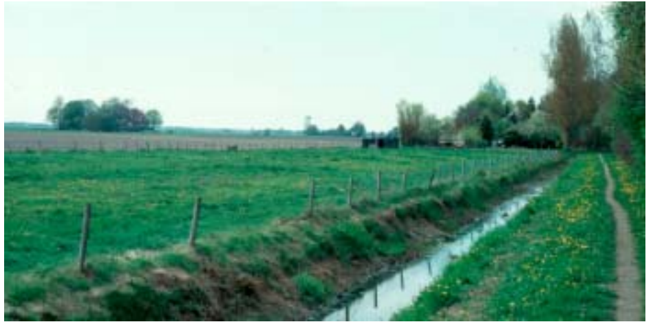
oeverzone op de grens met het agrarisch gebied