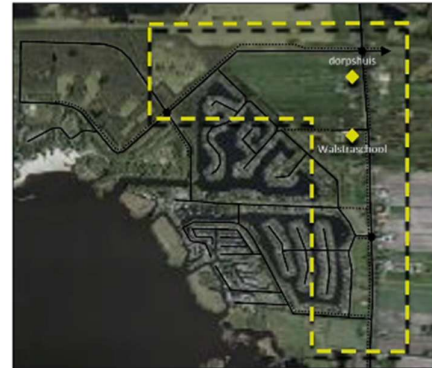
Afbeelding 1. Zoekgebied Kindcentrum

Bovenstaande punten hebben ertoe geleid dat we in het gebied op afbeelding 1 op zoek zijn gegaan naar een geschikte locatie.