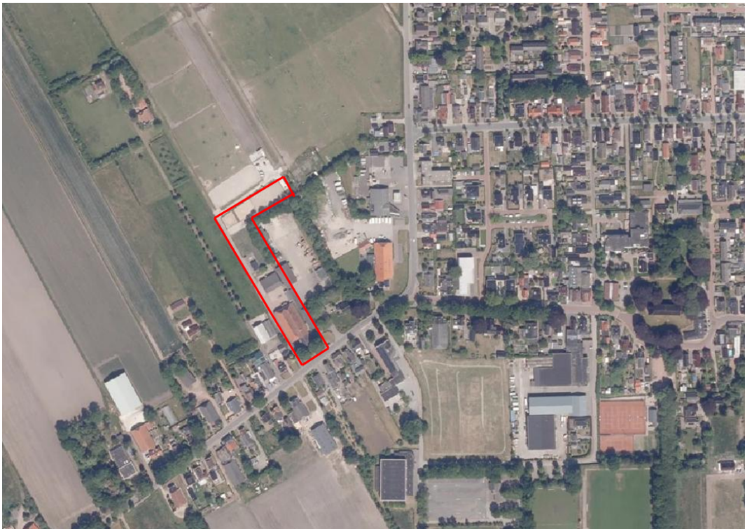
Figuur 1.1 Ligging plangebied; globaal weergegeven

Het plangebied is gelegen in de westelijke rand van het dorp Siddeburen in de gemeente Midden-Groningen. Aan de noordwestzijde van het plangebied is agrarische cultuurgrond gelegen. Het plangebied grenst voor de overige zijden aan bebouwing waarvan aan de oostzijde onder andere een bouwbedrijf en een tankstation zijn gesitueerd. Op de onderstaande afbeelding is de ligging van het plangebied globaal weergegeven.