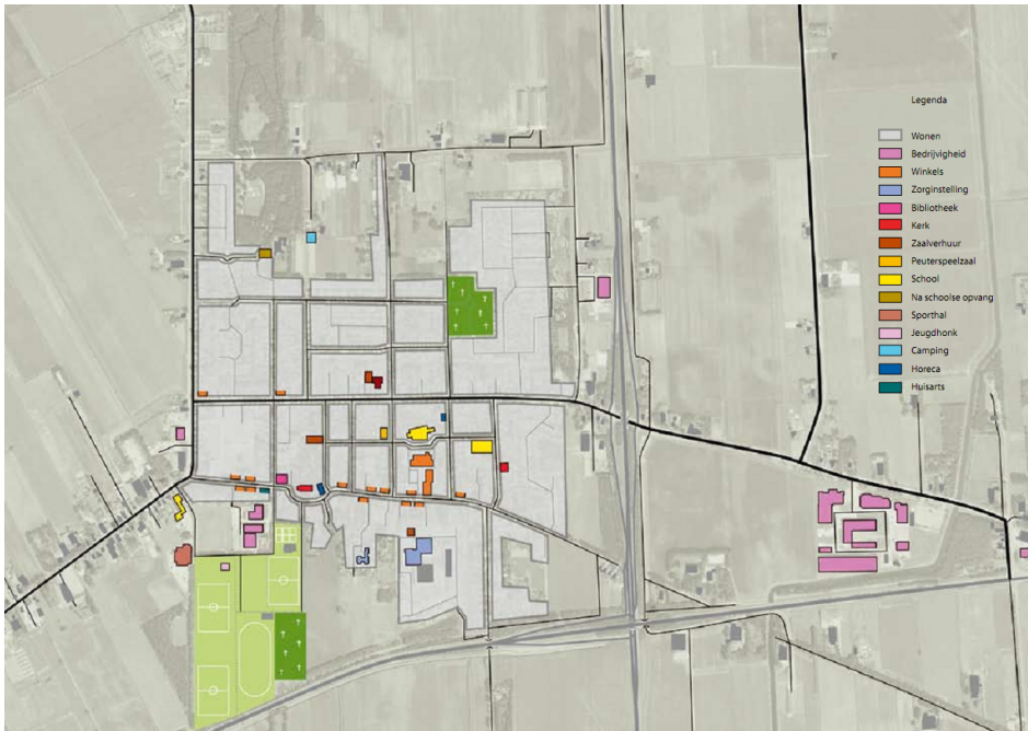
Figuur 2.3 Functiekaart Siddeburen, bestaande situatie 2009.

In de loop der tijd is het belang van de Hoofdweg als doorgaande route op zowel regionaal als lokaal niveau sterk afgenomen. Op regionaal niveau worden de verkeersstromen dankzij de komst van de N387 en N33 tegenwoordig om de kern heen geleid. Op lokaal niveau is er voor gekozen het doorgaande verkeer zoveel mogelijk uit het centrum te weren en via de Oudeweg te geleiden. Om deze reden maakt de Hoofdweg dan ook deel uit van een 30 km-zone. Gevolg van deze veranderende verkeersstromen is wel dat het zuidoostelijk deel van de kern steeds meer de uitstraling krijgt van een rustige woonwijk.