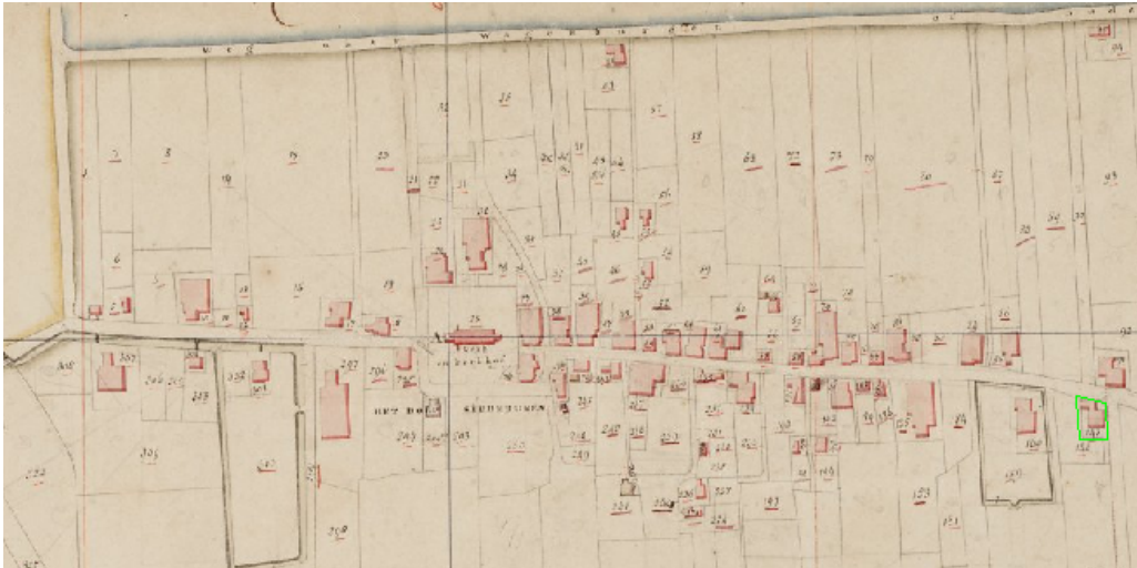
Figuur 2.1 Siddeburen, Kadasterkaart omstreeks 1811

Tegenwoordig vormen de Hoofdweg en de Oudeweg nog steeds de ruggengraat van het dorp. Bij de meeste uitbreidingen van de dorpsstructuur zijn de straten in elkaars verlengde, haaks op deze twee linten, doorgetrokken. Deze straten zijn vervolgens onderling verbonden met parallel aan de Oudeweg en de Hoofdweg lopende straten, waardoor uiteindelijk het huidige grid van Siddeburen is ontstaan (figuur 2.2). De buurtjes binnen de gridlijnen hebben ieder een eigen structuur, welke vaak wordt bepaald door de periode waarin ze zijn ontwikkeld. Uitzondering op deze gridstructuur vormt de uitbreiding in de jaren negentig in het noordoosten (Leeuwerikhoogte).