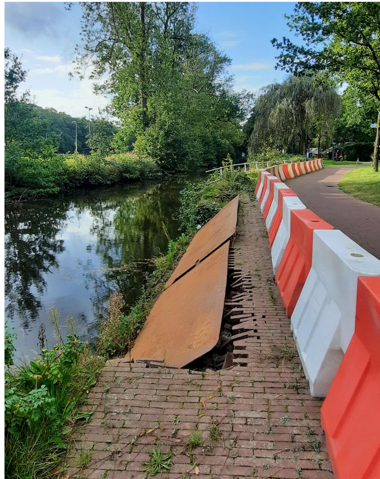
Situatie foto Okt. 2023