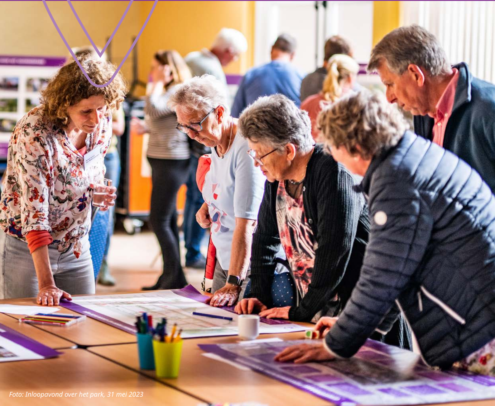
Foto: Inloopavond over het park, 31 mei 2023